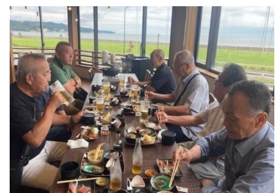
氷見市でのランチ