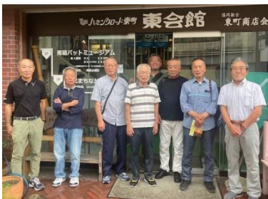
南砺バットミュージアム

9 月 25 日 (木)、富山県への視察研修を実施し、南砺市・氷見市方面へ行ってきました。南砺市のバット工場 (有)エスオースポーツ工業では、「求人を出さなくても全国から有志の若手職人が集まる」という企業風土のもと、熟練職人によるバット製作の課程を見学する中で、ブランド戦略の重要性について学ぶことができ、有意義な視察となりました。