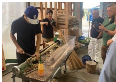
(有)エスオースポーツ工業 バット工場見学